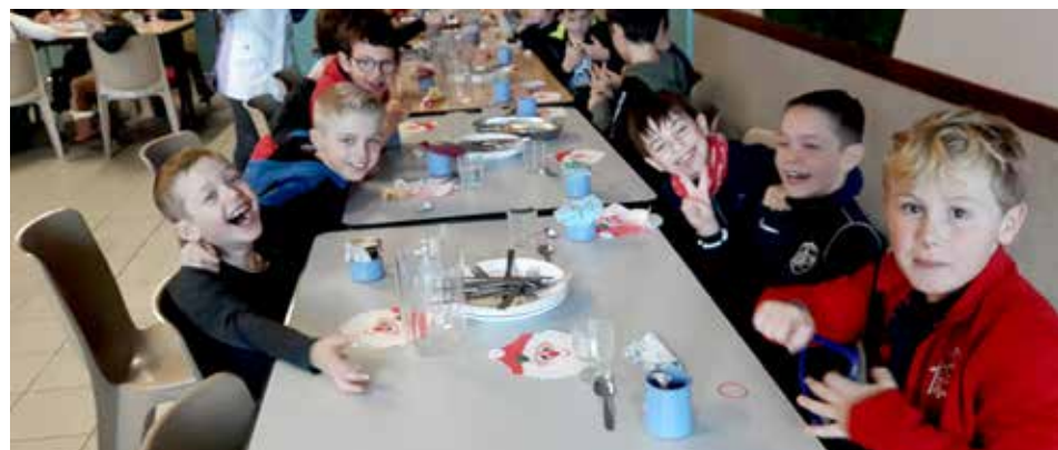
Ambiance détendue à la veille des vacances scolaire.