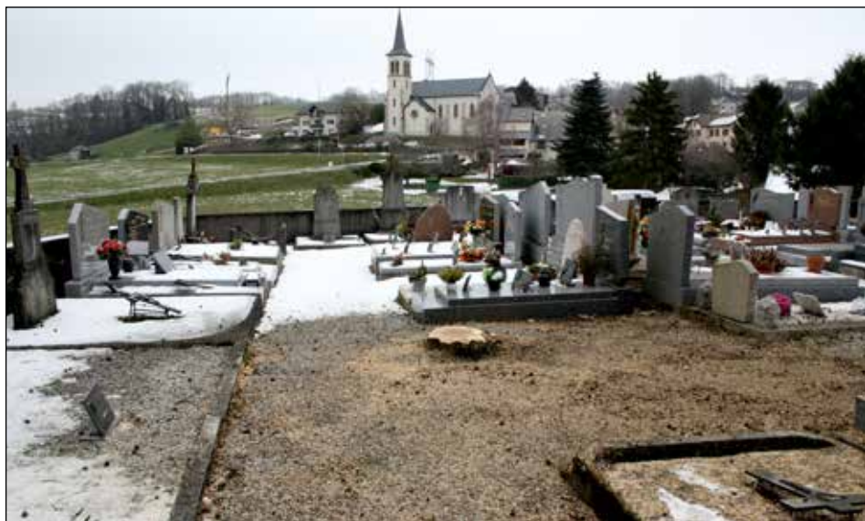
Les cyprès du cimetière ont été abattus, des arbustes seront replantés dès que les conditions le permettront.