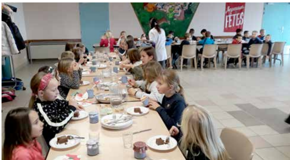
Beaucoup de monde pour le repas de Noël.

Lieu incontournable dans une scolarité, parfois acteur de mauvais souvenirs culinaires ou de franches rigolades entre élèves, la cantine a bien évolué et n'a pas fini de s'améliorer.